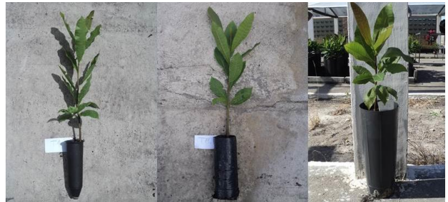
Figura 1. Plantas do porta-enxerto 'CCP 06' produzidas em tubetes (à esquerda), sacolas plásticas (ao centro) e citrovasos (à direita), aos 60 dias após a semeadura, época da enxertia.

Os dados obtidos foram submetidos à análise de variância ( p \leq 0,05 ). Em relação aos recipientes, as médias das características foram comparadas pelo teste de Tukey, a 5%. Já as doses do adubo foram ajustadas por meio de análise de regressão.