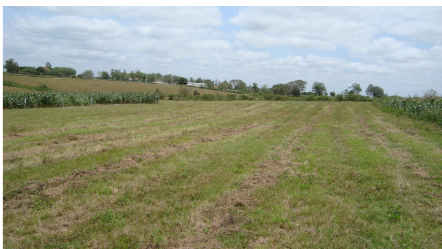
Figura 2 - Área onde foram descritos e amostrados os perfis no Campo Experimental Pedro Arle da Embrapa Tabuleiros Costeiros no Município de Frei Paulo em Sergipe.

Os perfis foram georreferenciados. As descrições foram feitas acordo com Santos et al.(2005). As análises foram análises físicas e químicas seguiram a metodologia preconizada pela Embrapa (Embrapa, 2011). Os perfis foram classificados com base no Sistema Brasileiro de Classificação de Solos (Embrapa, 2006).