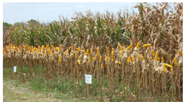
Figura 1 - Ensaio de competição de variedades e híbridos de milho adaptados às condições do Semiárido Sergipano. Campo Experimental Pedro Arle. Frei Paulo - SE.

no Campo Experimental Pedro Arle, foram observadas produtividades superiores a 11 t/ha em condições dependentes de chuva (Figura 1).