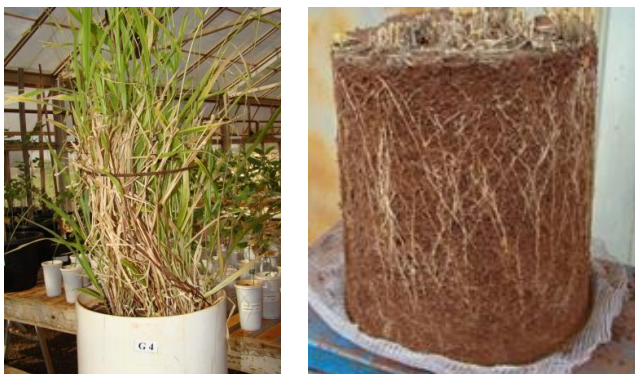
Figura 1 - Parcelas antes (à esquerda) e após a remoção do vaso (à direita).

A biomassa da parte aérea, ao longo do ensaio e em função dos tratamentos, foi coletada e pesada para obtenção da biomassa verde (MV) e, após secagem em estufa a 55° C, para obter a massa seca (MS). A adubação de cobertura, em kg ha -1 , foi 40 de N e 46 de S, aos 150 DAE, com sulfato de amônio diluído em água, sobre o solo. Aos 350 DAE, após a avaliação final da biomassa da parte aérea das plantas, para a amostragem e análise de estabilidade de agregados e da matéria orgânica do solo (MOS), os vasos foram cuidadosamente separados do substrato (Figura 1).